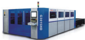
G3015HD激光切割機 G3015HD Laser Cutter