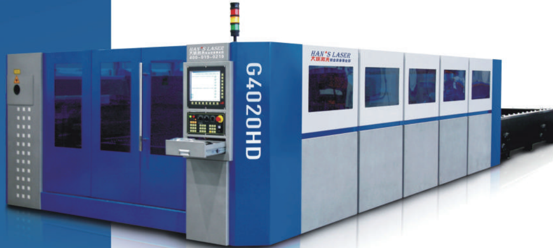
G4020HD激光切割機 G4020HD Laser Cutter

圖片為參考圖, 以實物為準 Pictures are only for reference, Please in kind prevail