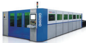
G6020HD激光切割機 G6020HD Laser Cutter