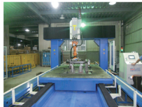
RC3122 三維六軸激光切割系統 RC3122 3-D 6 Axis Laser Cutting System